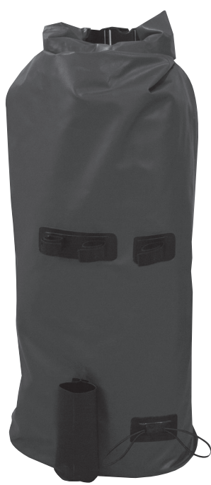
Storage Bag- Backpack

Sport en Recreatie Den Bol B.V. Heerwaardensestraat 30 6624 KK Heerwaarden the Netherlands Tel.: +31(0)487 573090